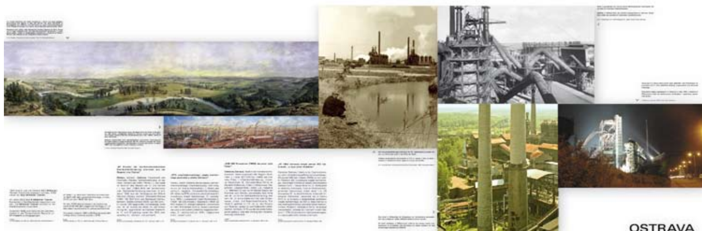
Panel wystawowy poświęcony Ostrawie